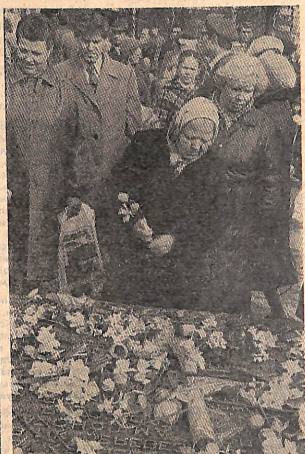
Парк Победы. 9 мая 1985 года